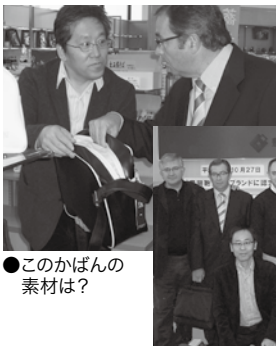
●このかばんの素材は?

スペイン靴関連業協会(AEC・アリカンテ県エルチェ市)の材料業者他4名が兵庫県靴工業組合を訪問、実際に靴を手に取り、素材や製法などの情報交換をしました。