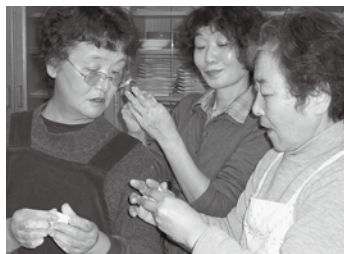
●こんな風に包むんですよ!