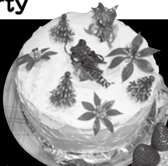
おいしそうなクリスマスケーキ!!

今年も自慢の美味しい料理とすばらしい仲間が集まり、楽しい時間を過ごすことができました。