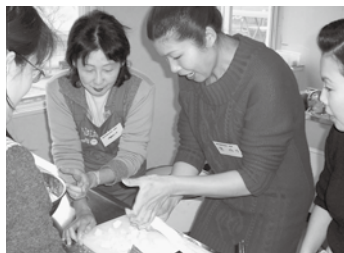
●こんな感じで生地を切ってね!