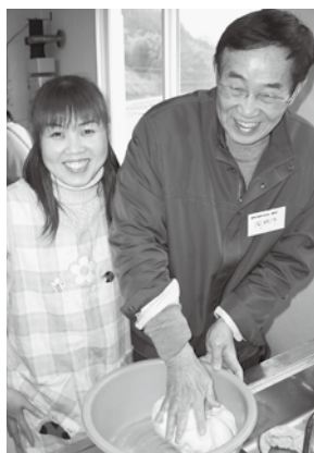
●おいしい生地、作ってね!