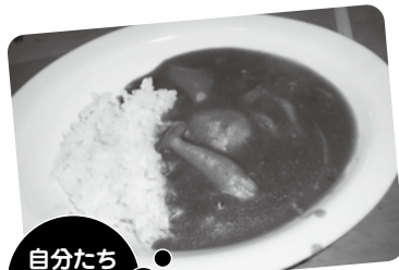
自分たちで作ったカレー

夏休みを利用して、タウマルヌイ高校生8名が来豊。日高の東西両中学校を訪問し、一緒に授業を受けたり、給食も食べました。また、竹野スノーケルセンターで、冬の海に潜り、すばらしい海の世界をのぞきました。兵庫県立コウノトリの郷公園では、コウノトリを見学し、保護増殖について詳しい話を聞きました。