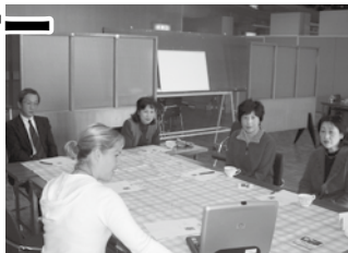
●写真を使って説明中

アメリカ出身のエイリー（豊岡市在住）を迎え、アメリカの文化や習慣などについて探検をしました。