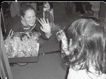
お土産の松ぼっくりで作ったクリスマスツリー