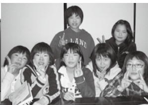
●楽しいホームステイ!!