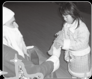
●サンタさん、プレゼントありがとう!!

Tia'sあみごすのステキな歌声で開幕したクリスマスパーティー!たくさんのお友だちと歌を歌ったり、ゲームをしたり、楽しい時間を過ごすことができました。お土産の松ぼっくりで作ったクリスマスツリーもかわいかったね。